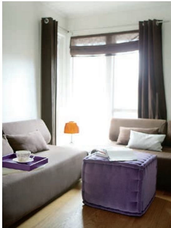
Barnestue. Barna har en egen sofagruppe i sin fløy. Sofaer fra Ikea, puff fra Falkendal.

«Man trenger ikke sitte i hvert sitt rom selv om man holder på med forskjellige ting.»