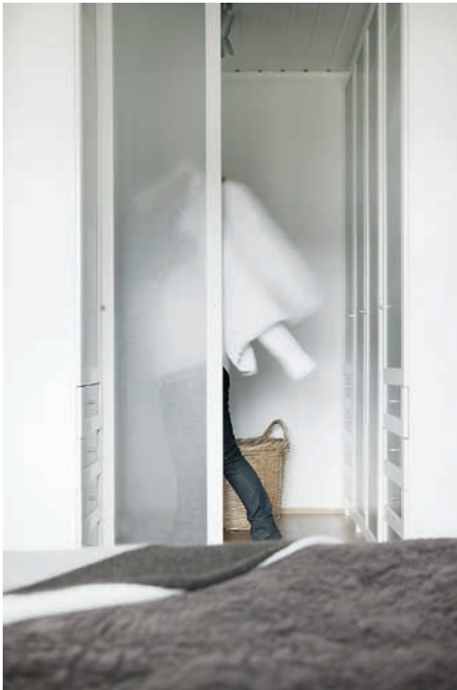
Klesskap. En skyvedør kledd med et transparent tekstil gir en opplevelse av walk-in-closet uten å minske romfølelsen på soveværelset.