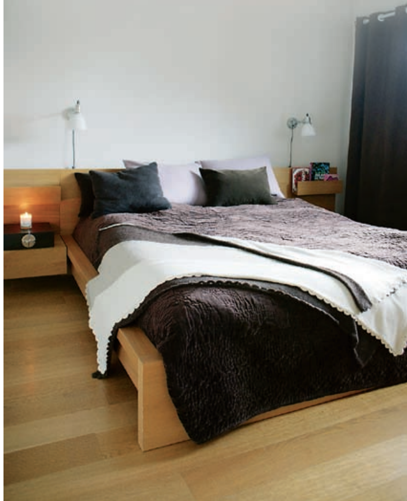
Eksklusiv touch. Sengemøblemet fra Ikea oppleves med nye øyne kledd i fløyelspledd fra Day Home og strikket pledd i alpakkauil fra Dehn Design.