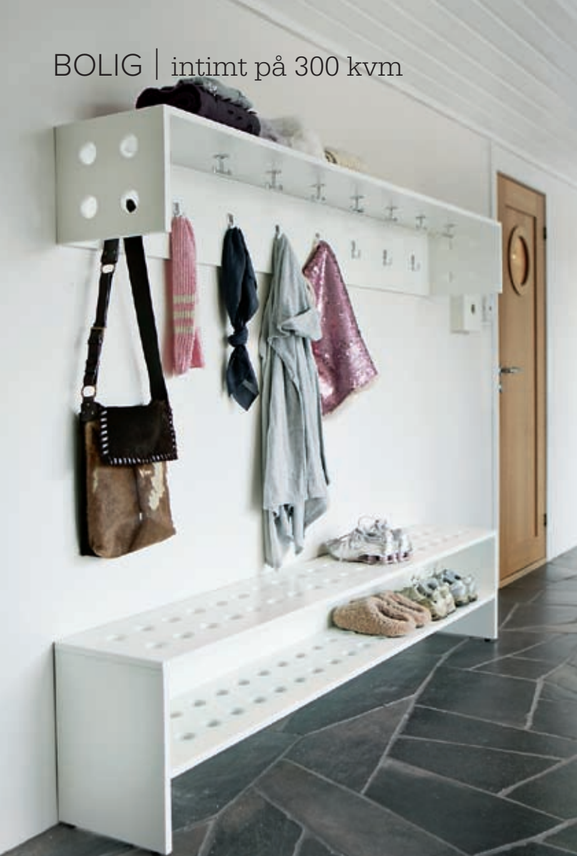
Velkomstmøbler. Entreen er lys og åpen. Da synes rot og uorden desto bedre. Meretes spesialtilpassede entrémøbler har en preventiv effekt. Produktene forhandles i de største byene, Dehn Design.

Sov søtt. Storesøster på 14 er i ferd med å utvikle en voksen smak. Seng med flettet gavl og mobilt nattbord fra Ikea. Sengeteppe og intimiserende sengehimmel fra Anouska.